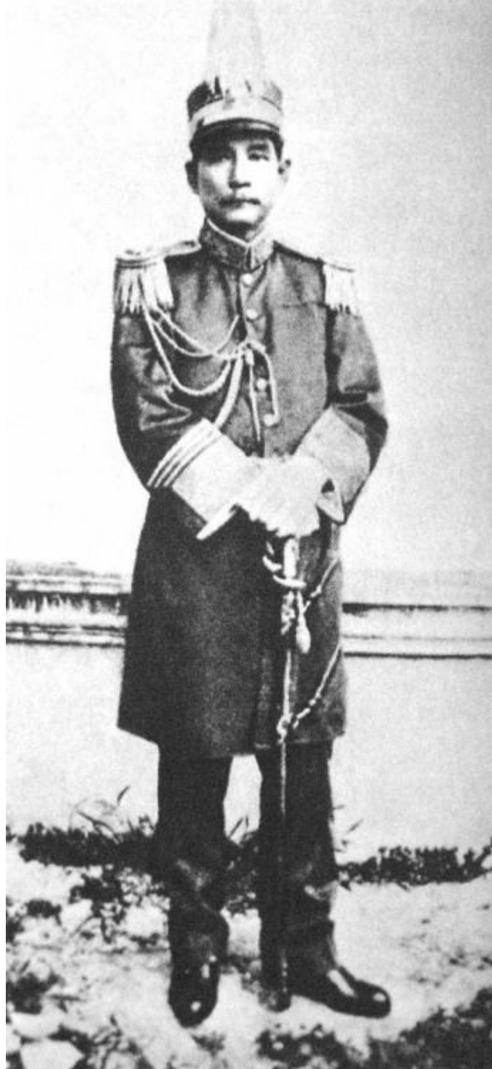
出任广州军政府海陆军大元帅的孙中山